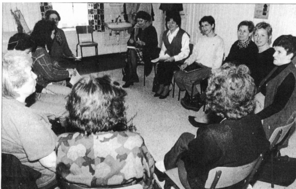
Un groupe d'apprentissage, en cercle